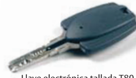
Llave electrónica tallada T80