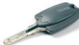
Llave electrónica tallada TX80